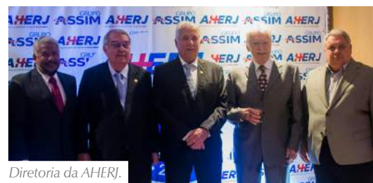
Diretoria da AHERJ.