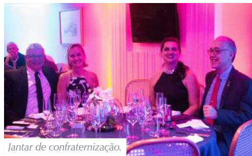
Jantar de confraternização.