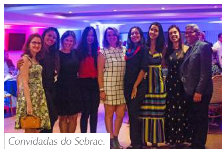
Convidadas do Sebrae.