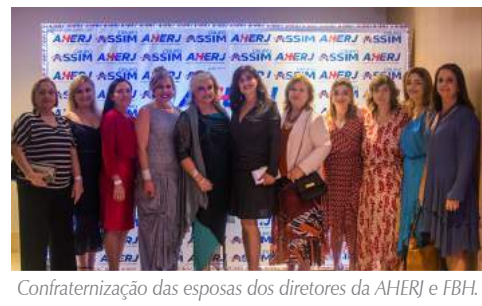
Confraternização das esposas dos diretores da AHERJ e FBH.