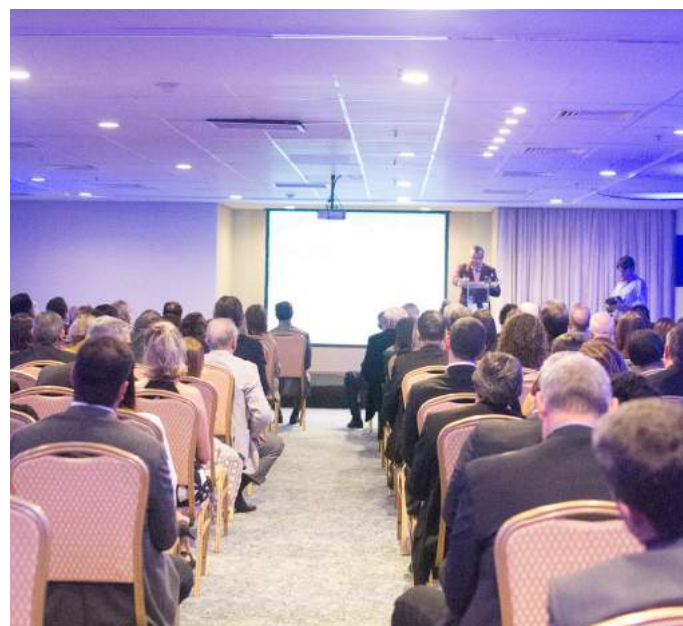
Panorâmica do auditório na solenidade de premiação.

A trajetória de cinco décadas da Associação de Hospitais do Estado do Rio de Janeiro (AHERJ) foi comemorada em uma solenidade especial no Dia do Médico, 18 de outubro, no Windsor Leme Hotel, em Copacabana, Rio de Janeiro. Estiveram presentes cerca de 200 pessoas, entre funcionários, colaboradores, diretores, magistrados, políticos e representantes das entidades do setor de saúde, não só do Estado do RJ, mas também de todo país.