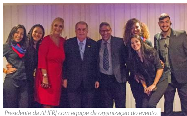
Presidente da AHERJ com equipe da organização do evento.