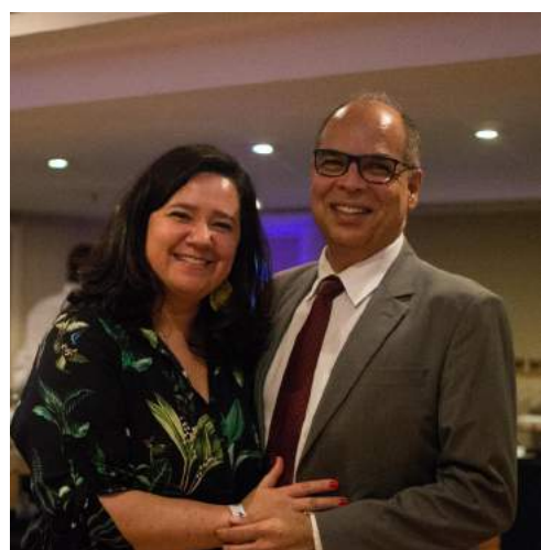
Presidentes da Sociedade de Hotelaria Hospitalar do Estado do Rio de Janeiro e do Sindicato de Lavanderias e Similares do Estado do RJ.