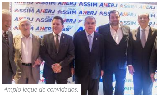
Ampla leque de convidados.