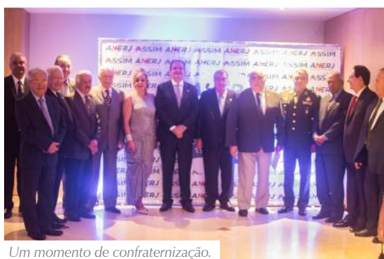
Um momento de confraternização.