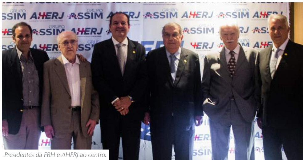
Presidentes da FBH e AHERJ ao centro.