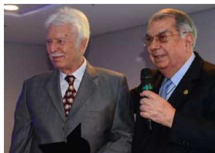
O presidente da AHERJ entregou a placa ao homenageado.