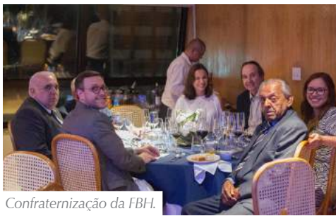
Confraternização da FBH.