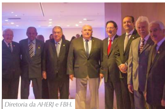
Diretoria da AHERJ e FBH.